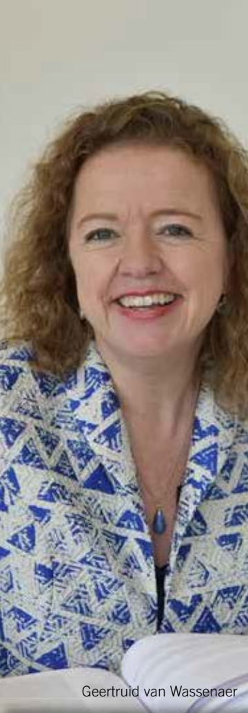
Geertruid van Wassenaer